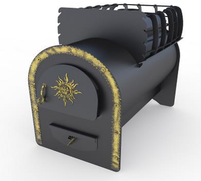
рис. 5 Горыня