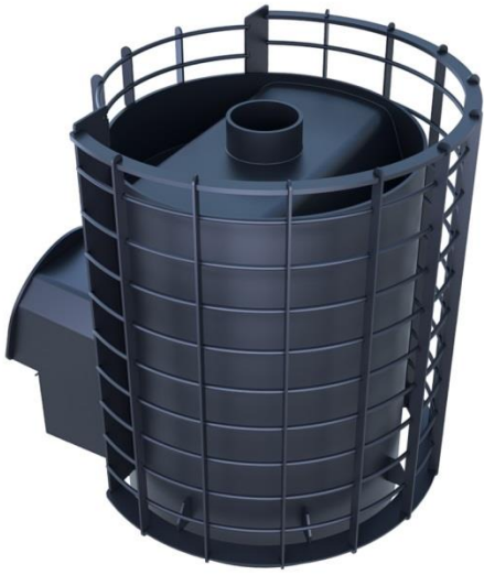
рис. 1 Вольга