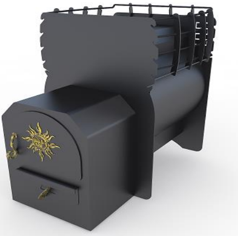
рис. 3 Затея