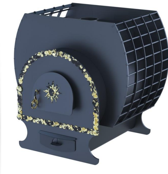
рис. 6 Добрыня 1