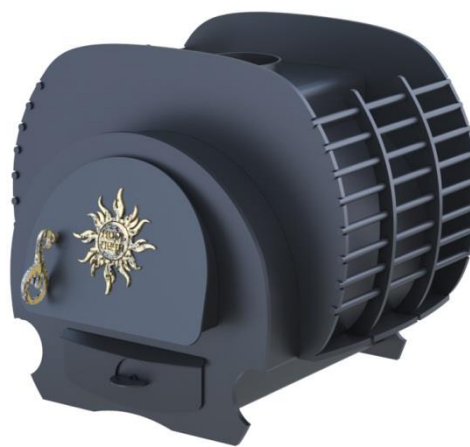
рис. 8 Малуша