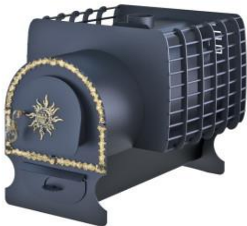
рис. 7 Святогор