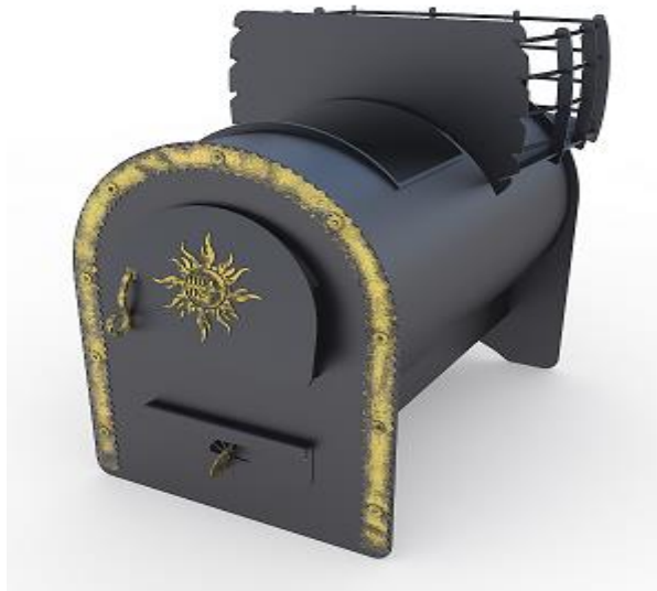
рис. 4 Любания