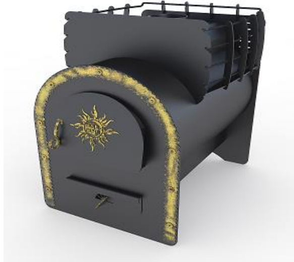
рис 2 Забава